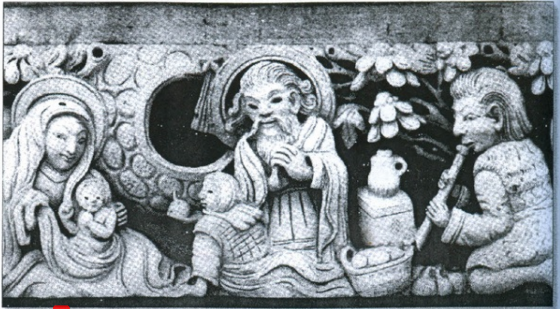
1 Adoration des bergers. Haut-relief de l'église catholique de Denpasar (Bali).

Dans le diocèse de Kupang, Nusa Tenggara Timor, on a pu organiser des réinstallations de réfugiés du Timor Leste, victimes du conflit qui a précédé l'indépendance du Timor Leste 32 .