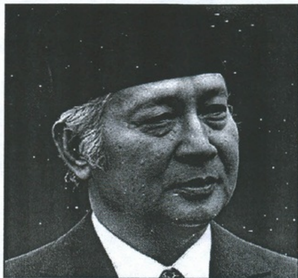
1 Suharto, né le 8 juin 1921 et mort le 27 janvier 2008 à Jakarta, fut président de la République d'Indonésie de 1967 à 1998.

1 population et le lien social et la poursuite de l'idéal social et politique 1 fiché par le gouvernement. Les citoyens se sentaient abandonnés 9 . Les crises du gouvernement et des institutions gouvernementales de tous ordres continuent jusqu'à ce jour.