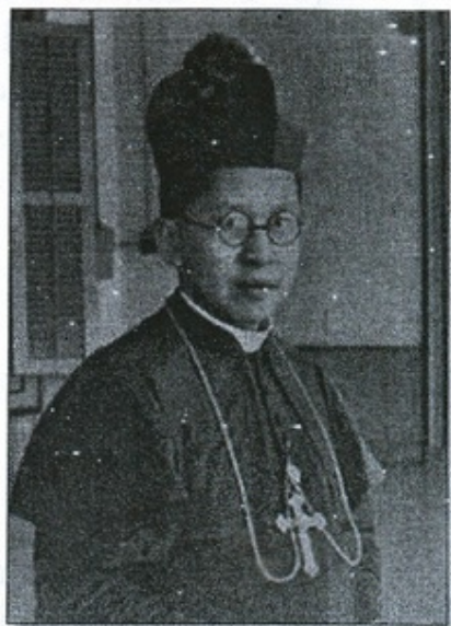
Mgr SOEGIJAPRANATA SJ (1896-1963)