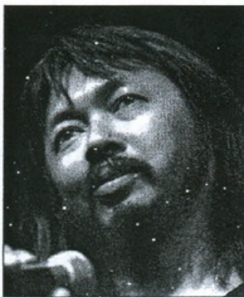
Seno Gumira AJIDARMA (1958 -)