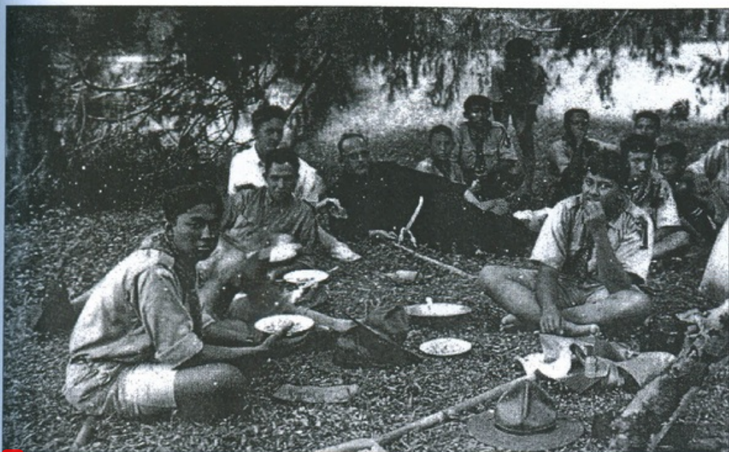
1 Dans les années 1930, un groupe de scouts avec un Père jésuite, à Java, symbole de la stratégie de la Compagnie visant les élites indonésiennes à travers leurs établissements d'enseignement secondaire.

Premièrement, l'aspect pratique et opérationnel. Dans les années 1980, sous l'influence du boom pétrolier, le gouvernement indonésien a construit des écoles, du primaire au secondaire, s'étendant à des régions isolées. Ce développement a influé sur les écoles chrétiennes qui ont perdu des élèves. D'autre part le gouvernement a arrêté son soutien, ne donnant plus d'enseignants aux écoles chrétiennes. Ce qui signifie que les écoles chrétiennes ont dû faire face à des problèmes financiers.