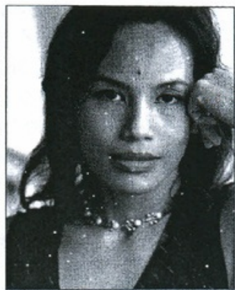
Ayu UTAMI (1968 -)

1 Quelques-uns des grands écrivains dont les œuvres évoquent les souvenirs et les traumatismes de la tragédie nationale de 1965.