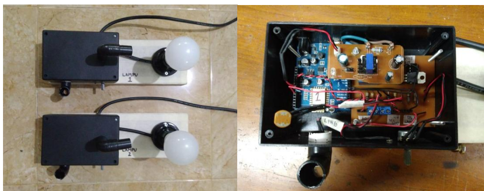
Gambar 3. Hasil Implementasi Sistem Lampu

Hasil perancangan Sistem kontrol dan deteksi nyala lampu penerangan jalan melalui jaringan nirkabel terdiri dari dua bagian utama yaitu box kontrol dan lampu. Pada box kontrol terdiri dari dua rangkaian sensor LDR, WeMos D1, adaptor 12 volt, rangkaian relay.