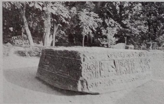
Watu Gilang ing Baturetno, Bantul.

Ing Kutha Gedhe, persise ing ngarep pasareyan Astharengga, watu gilang tinggalane raja Mataram kerep dadi tujuwan wisata sujarah, klebu turis manca. Turis ora ngalap berkah, nanging pengin weruh riwayat ing suwalike petilasan kang dikramatke para warga iku. Beda karo warga, saben malem Jumuwah Kliwon akeh priayi golek wangsit lan weninge batin