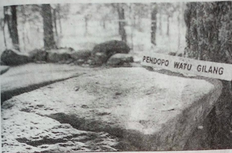
Pendhapa Watu Gilang ing Situs Sangiran, Saradan, Kabupaten Madiun.