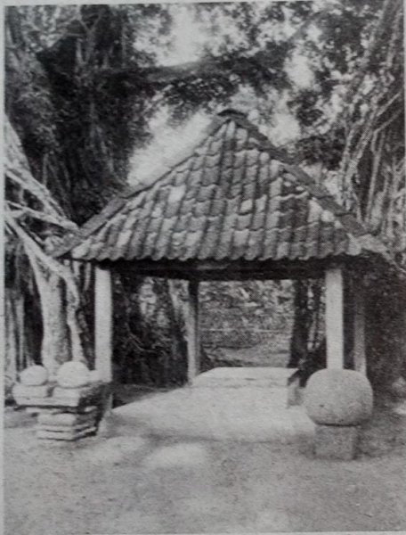
Watu gilang kang disebut-sebut tilas palungguhane Panembahan Senapati. Ing kono, ujure kandha, mustakane Ki Ageng Mangir Wanabaya dijeblesake engga prapteng lampus.

Masyarakat bakal mapag pilkada ing satengahé pageblug corona 9 Desember 2020. Umume ing pasamuhan cilik lan gedhe, tim sukses para calon gubernur, bupati, utawa walikota siyap dhelikan mbujuki masyarakat supaya aja nganti lali coblos "juragane" pas acara pilkada mbesuk. Dhuwit sekarung diudokne supaya bisa lungguh ing kursi panguwasa.