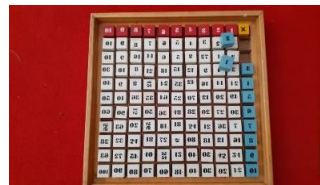
Gambar 4. Media

warna, usia dan juga konsep. Gradasi warna artinya pemilihan warna yang digunakan mulai dari yang muda sekali, muda dan sampai tua sekali. Gradasi usia artinya media yang dibuat dapat digunakan untuk usia awal yaitu 0 sampai 6 tahun dan juga dapat digunakan untuk usia lanjut yaitu antara 6 sampai usia 9. 3) Memiliki pengendali kesalahan ( auto-correction ). Auto corection artinya media yang dibuat ataupun yang digunakan memiliki pengendali kesalahannya dan disini anak dapat tahu letak kesalahannya sendiri tanpa harus tergantung pada orang lain. 4) Membelajarkan siswa secara mandiri ( auto-education ). Auto education artinya bahwa media memiliki unsur kemandirian. Maksudnya media yang dibuat ataupun digunakan memiliki unsur yang dapat membuat anak menjadi mandiri. Mandiri dalam hal ini adalah media yang dibuat ataupun yang digunakan dapat membantu anak secara mandiri tanpa bantuan orang lain. Gambar 4 dan gambar 5 adalah contoh media Montessori.