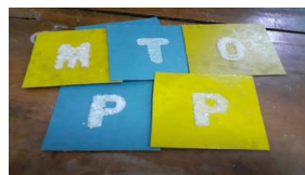
Gambar 2. Sandpaper letters

Berikut adalah rincian materi kelas 1 yaitu : huruf abjad yaitu huruf vokal dan konsonan dan media yang digunakan : sandpaper letters , kotak rahasia.