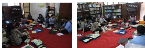
Gambar 3. Pelatihan Metode Montessori bersama Guru

Ada satu calon guru yang melakukan implementasi di kelas 5. Berikut adalah implementasi yang dilakukan topik interaksi sosial. Media montessori mengenai interaksi sosial dengan cara mencocokkan gambar dengan keterangan gambar. Autocorrectionnya atau pengendali kesalahan pada ketepatan gambar dengan keterangan gambar. Selama melakukan implementasi, calon guru memperhatikan beberapa hal yaitu : Dalam pembelajaran metode Montessori anak diberi kebebasan untuk memilih aktivitas media sesuai dengan keinginannya. Agar anak dapat membuat pilihan maka harus diperkenalkan beberapa media yang dirancang agar dapat digunakan secara mandiri atau auto-education (Lillard, 1972: 54-55). Kegiatan pengabdian kepada masyarakat selanjutnya adalah pelatihan pada guru-guru dengan topik media Montessori. Guru mendengarkan penjelasan dari amteri, selanjunya guru menyusun media dalam pembelajaran. Berikut adalah Kegiatan Pelatihan Montessori