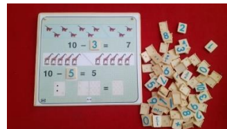
Gambar 5. Media Montessori