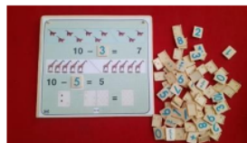
Gambar 5. Media Montessori