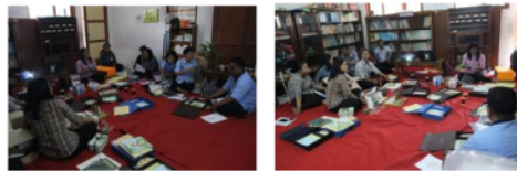
Gambar 3. Pelatihan Metode Montessori bersama Guru

Ada satu calon guru yang melakukan implementasi di kelas 5. Berikut adalah implementasi yang dilakukan topik interaksi sosial. Media montessori mengenai interaksi sosial dengan cara mencocokkan gambar dengan keterangan gambar. Autocorrectionnya atau pengendali kesalahan pada ketepatan gambar dengan keterangan gambar. Selama melakukan implementasi, calon guru memperhatikan beberapa hal yaitu : Dalam pembelajaran metode Montessori anak diberi kebebasan untuk memilih aktivitas media sesuai dengan keinginannya. Agar anak dapat membuat pilihan maka harus diperkenalkan beberapa media yang dirancang agar dapat digunakan secara mandiri atau auto-education (Lillard, 1972: 54-55). Kegiatan pengabdian kepada masyarakat selanjutnya adalah pelatihan pada guru-guru dengan topik media Montessori. Guru mendengarkan penjelasan dari amteri, selanjunya guru menyusun media dalam pembelajaran. Berikut adalah Kegiatan Pelatihan Montessori