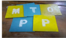
Gambar 2. Sandpaper letters

Berikut adalah rincian materi kelas 1 yaitu : huruf abjad yaitu huruf vokal dan konsonan dan media yang digunakan : sandpaper letters , kotak rahasia.