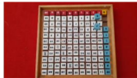
Gambar 4. Media

warna, usia dan juga konsep. Gradasi warna artinya pemilihan warna yang digunakan mulai dari yang muda sekali, muda dan sampai tua sekali. Gradasi usia artinya media yang dibuat dapat digunakan untuk usia awal yaitu 0 sampai 6 tahun dan juga dapat digunakan untuk usia lanjut yaitu antara 6 sampai usia 9. 3) Memiliki pengendali kesalahan ( auto-correction ) . Auto correction artinya media yang dibuat ataupun yang digunakan memiliki pengendali kesalahannya dan disini anak dapat tahu letak kesalahannya sendiri tanpa harus tergantung pada orang lain. 4) Membelajarkan siswa secara mandiri ( auto-education ). Auto education artinya bahwa media memiliki unsur kemandirian. Maksudnya media yang dibuat ataupun digunakan memiliki unsur yang dapat membuat anak menjadi mandiri. Mandiri dalam hal ini adalah media yang dibuat ataupun yang digunakan dapat membantu anak secara mandiri tanpa bantuan orang lain. Gambar 4 dan gambar 5 adalah contoh media Montessori.