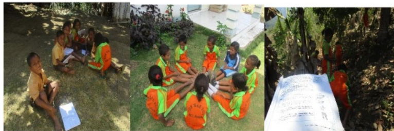
Gambar 4.1 Kegiatan Belajar di Luar Kelas

Saya ingin membawa pelita meskipun hanya secercah cahaya bagi mereka, memberi semangat masa depan sebagai bekal yang mungkin akan berguna suatu hari nanti. Apalagi saat saya ditempatkan di SDN Waepoa. Sebisa mungkin saya ingin bermanfaat untuk mereka selama satu tahun berada disana dengan banyak hal salah satunya pada proses pembelajaran misalnya melakukan proses pembelajaran dilakukan di dalam dan luar kelas menggunakan berbagai variasi dalam metode pembelajaran untuk mengurangi kejenuhan belajar di dalam kelas karena setiap siswa memiliki cara tersendiri dalam menyerap materi pelajaran. Saya juga selalu menanamkan jiwa semangat belajar, cinta tanah air, baik terhadap sesama dan alam sekitar. Hanya hal-hal kecil yang bisa saya berikan kepada mereka seperti halnya kasih sayang. Meskipun tangis perpisahan waktu itu sangat pecah.