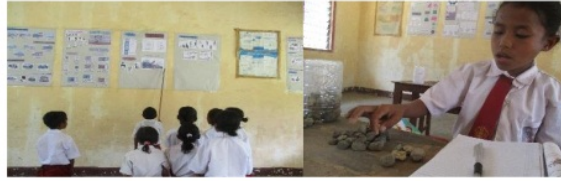
Gambar 4.2 Kegiatan Belajar di Dalam Kelas