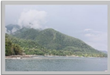
Gambar 2. Kampung Peitoko Desa Purnama

Saya mengajar sebagai guru sekolah dasar, karena memang basic saya lulusan dari prodi PGSD. Selama masa pengabdian, saya tinggal di rumah jabatan kepala sekolah. Saya tinggal bersama kepala sekolah SD GMIT Peitoko dan juga rekan SM-3T yang bertugas di SMP Negeri Purnama.