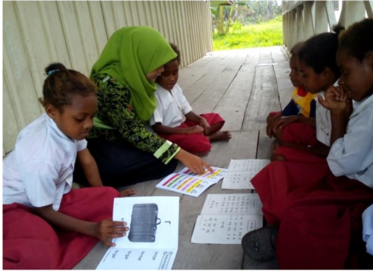
(Foto saat saya menjadi guru SM-3T di SD Inpres 21 Tarof, Papua Barat)

Saya merasa mengalami perubahan positif dalam diri saya. Saya menjalani kehidupan asrama yang melatih kedisiplinan yang tinggi, saya belajar menjadi orang yang disiplin dan meninggalkan sikap suka mengeluh dan bermalas-malasan. Saya merasa harus selalu siap. Saya bersyukur mendapat kesempatan PPG dan ditempatkan di Universitas Sanata Dharma. Saya merasa semakin mantap untuk menjadi seorang guru, guru yang dirindu murid-muridnya, guru yang tidak hanya mengajar di depan muridnya dan menjelaskan materi, namun saya ingin menjadi seorang guru yang bisa menginspirasi murid-murid saya. Menjadi seorang guru SD memang tidak mudah, namun saya optimis bisa menjadi guru SD yang profesional karena telah mendapat pendidikan profesi guru. Penyelenggaraan PPG PGSD Universitas Sanata Dharma yang bermutu baik mendukung berkembangnya potensi dalam diri saya. Pengetahuan dan pengalaman-pengalaman yang saya peroleh dari Universitas Sanata Dharma melalui program workshop PPG antara lain adalah makin lancar dalam membuat perangkat pembelajaran, makin bertambahnya pengalaman mempraktikkan berbagai model pembelajaran yang dapat mengaktifkan siswa, bertambahnya pengetahuan mengenai Paradigma Perspektif Refleksi yang merupakan ciri khas Universitas Sanata Dharma. Workshop PPG di Universitas Sanata Dharma