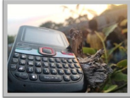
Gambar 5. Pohon sinyal, tempat handphone diletakan.

Kecamatan Pureman berjarak sekitar 90-95 km dari kota kabupaten dengan waktu tempuh 5-7 jam menggunakan motor maupun kendaraan roda empat yang dimodifikasi untuk melintasi jalan-jalan pegunungan yang disebut dengan Panser . Sedangkan jarak kecamatan Pureman menuju ke kota dengan jalur laut lebih jauh dan lama karena harus memutari setengah dari Pulau Alor. Perjalanan yang biasa di tempuh adalah jalur laut karena alat transportasi umum hanya menggunakan perahu motor saja. Sedangkan untuk darat menggunakan transportasi pribadi atau sewa. Perjalanan laut yang saya tempuh biasa dengan waktu normal 9-11 jam, namun jika muatan banyak dan gelombang laut tidak bersahabat akan memakan waktu lebih lama lagi. Saya pernah mengalami perjalanan yang sangat lama yaitu 15 jam, berangkat dari pelabuhan di Kalabahi jam 7 pagi dan sampai di kampung peitoko jam 10 malam.