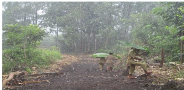
Gambar 2.3 Jalanan Licin Saat Hujan

Pemandangan yang menakjubkan disuguhkan setiap pagi jika cuaca cerah. Sebelah kanan gunung Inerie, menengok ke belakang adalah Laut Sawu, menengok ke kiri adalah perbukitan Manggarai Timur. Saat hujan yang memprihatinkan adalah sering tergelincirnya siswa dan guru yang berjalan kakikarena jalan masih berupa tanah yang licin saat terkena air hujan.