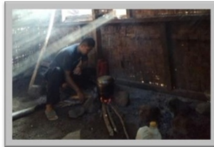
Gambar 3. Kondisi rumah Saya di penempatan

Akses komunikasi dan transportasi termasuk sulit karena jaringan komunikasi seperti sinyal handphone yang belum bisa menjangkau desa ini, jalur transportasi yang cukup lama ditempuh dengan jalur laut selama 9-12 jam bahkan lebih menyesuaikan dengan kondisi laut dan muatan yang dibawa dalam perahu motor, ditambah dengan jaringan listrik yang belum sampai di daerah tersebut. Sinyal komunikasi handphone di penempatan hanya ada sinyal negara tetangga yaitu Timor Leste. Untuk mendapatkan sinyal saya harus mendaki ke beberapa bukit dengan menempuh perjalanan selama 3-4 jam. Tempat sinyal ini dinamakan pohon sinyal, kita harus meletakkan handphone kita dan menunggu ada sinyal, ketika sudah dapat kita tidak boleh memindahkan atau menggerakkan handphone kita karena akan menghilangkan sinyal.