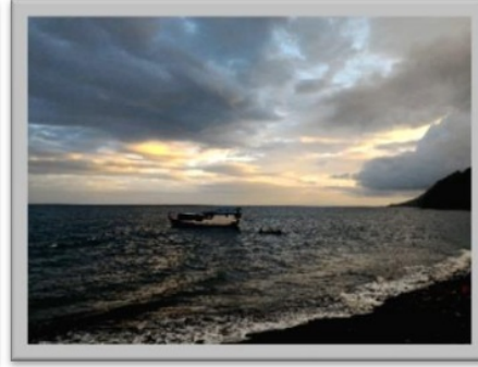
Gambar 7. Perahu besar yang hanya berlabuh di laut yang dalam.

Tidak hanya sulitnya perjalanan menuju kepenempatan, di daerah penempatan saya juga masih banyak hewan liar yang sering masuk ke desa,