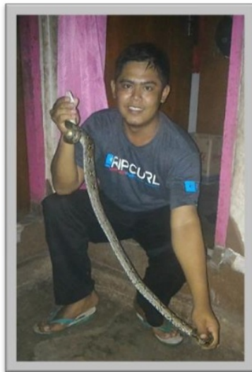
Gambar 8. Penulis menemukan ular piton yang masuk ke dalam rumah.

Tidak hanya sulitnya perjalanan menuju kepenempatan, di daerah penempatan saya juga masih banyak hewan liar yang sering masuk ke desa,