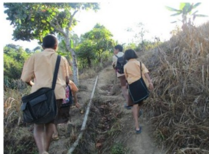
Gambar 2.4 Jalan Mendaki