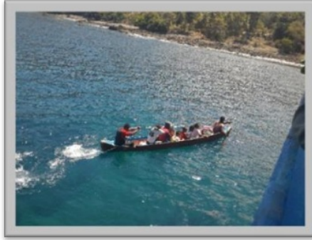
Gambar 6. Turun dari perahu besar sambung naik sampan menuju daratan.

akhirnya air masuk ke sampan, akhirnya kita pun tenggelam. Kami yang tenggelam sekitar 7-8 orang masing-masing berenang menyelamatkan diri.