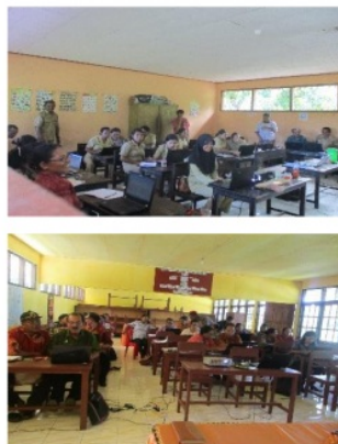
Gambar 4.4 Pembelajaran IT