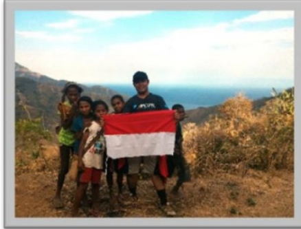
Gambar 4. Perjalanan mencari sinyal.