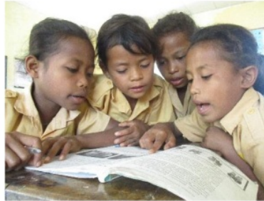
Gambar 4.13 Kegiatan Pagi Membaca