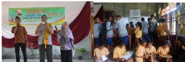
Gambar 4.17 Kegiatan Rumah Nalar Aimere

disebut Ngada Education Project yaitu: (1) rumah baca yaitu bentuk kegiatan yang menyediakan tempat untuk membaca di 6 kecamatan seperti Soa, Riung, Jerebuu, Riung Barat, Golewa, dan Aimere yang lokasinya mudah diakses oleh masyarakat; (2) Salam dari Ngada sebagai bentuk rasa simpati dan toleransi dari seluruh warga Indonesia melalui kegiatan donasi buku serta dana untuk masyarakat Ngada; (3) Ngada membaca sebagai wadah dalam menumbuhkan budaya membaca bagi anak-anak maupun orang dewasa. Saya selaku pembawa acara pada kegiatan Rumah Nalar di Kec. Aimere.