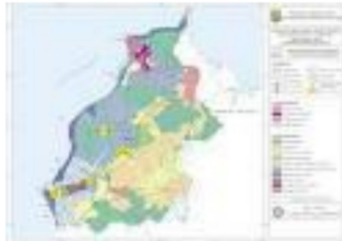
Gambar 2.1. Peta Kabupaten Sambas