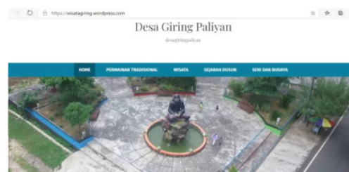
Gambar 1. website Wisata Giring

Kemudahan dalam pemeliharaan website perlu dipertimbangkan mengingat tidak semua orang menguasai bahasa pemrograman. Pemeliharaan website Desa Giring ditangani oleh satu orang yang juga merangkap pekerjaan lainnya. Selain kemudahan dalam pemeliharaan, waktu yang diperlukan untuk pemeliharaan relatif singkat sehingga tidak mengganggu pekerjaan yang lain.