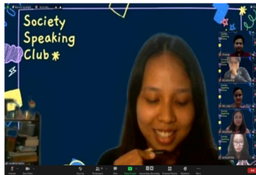
Gambar 1. Foto MC membuka acara SSC

Sesi pertama kegiatan Society Speaking Club dilaksanakan pada hari Jumat, 19 Februari 2021 pada pukul 16.00-17.30 WIB melalui Zoom meeting. Total peserta di sesi pertama adalah 27 peserta. Acara dibuka oleh MC dengan memperkenalkan garis besar program SSC dan tema diskusi kepada para peserta. MC juga memperkenalkan fasilitator yang akan mendampingi para peserta dalam berlatih speaking dan narasumber. Setelah sesi pembukaan oleh MC selama 10 menit, acara dilanjutkan dengan sesi pertama yang menghadirkan narasumber seorang Dosen Psikologi dari USD, yaitu Bapak C. Siswa W., M.Psi.