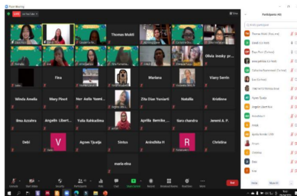
Gambar 4. Foto Peserta SSC Seri Ketiga

Antusiasme para peserta inipun berlanjut di ruang diskusi kecil dimana dengan bantuan fasilitator peserta membagikan pengalaman mereka dan hal-hal sederhana yang sudah mulai mereka terapkan terkait dengan lingkungan. Peserta nampak sudah sangat menikmati menggunakan Bahasa Inggris dalam membagikan pengalaman dan tips-tips menjaga lingkungan. Diskusi seri ini tidak hanya melatih keterampilan berbicara dalam Bahasa Inggris namun juga menambah wawasan peserta tentang pentingnya menjaga lingkungan. Dengan memahami dampak-dampak yang bisa terjadi di masa depan, kesadaran peserta untuk menjaga lingkungan serta turut aktif mengkampanyekan isu-isu lingkungan mulai muncul. Seri ini berlangsung cukup seru, terbukti dari para peserta yang dengan sukarela menjadi perwakilan untuk mempresentasikan hasil pembahasan diskusi kelompok kecil dalam kelompok besar.