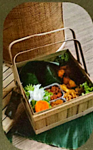
Hantaran Nasi Kuning dalam keranjang untuk 2 porsi Rp 120.000

Jl. Kabupaten no.131, Sleman, Yogyakarta