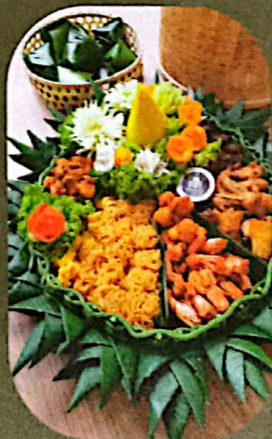
Tumpeng Nasi Kuning start from : Rp 450.000 bisa custom order sesuai keinginan anda