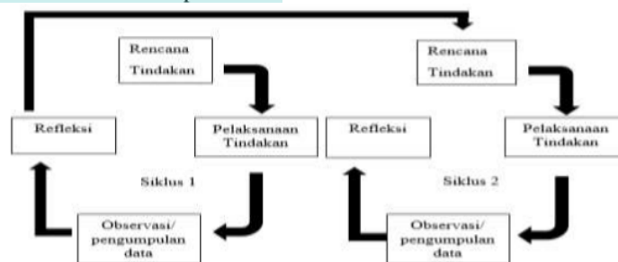
Gambar 1 Siklus Penelitian Tindakan Kelas

Penelitian ini menggunakan model Kemmis dan Taggart. Menurut (Kusumah & Dwitagama, 2010) ada dua siklus yang dilakukan dalam penelitian ini dimana setiap siklusnya terdiri dari dua kali pertemuan.