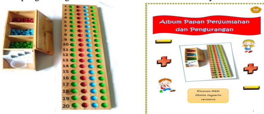
Gambar Media dan Albumnya

Hasil kuesioner analisis kebutuhan oleh guru diperoleh informasi bahwa guru sangat mendukung untuk ketersediaan dan penggunaan media di dalam proses pembelajaran. Guru juga memberikan saran untuk pembuatan media. Dan hasil kuesioner analisis kebutuhan oleh siswa diperoleh informasi tentang kriteria media yang diminati oleh mereka. Kualitas dari media ditentukan dari hasil kuesioner validasi produk yang diberikan kepada dosen ahli dan guru kelas II. Rata-rata skor validasi media yaitu 3,25 dikategorikan baik sedangkan rata-rata skor validasi album media yaitu 3,3 dikategorikan sangat baik. Berikut ini adalah gambar dari pengembangan media Montessori beserta albumnya.