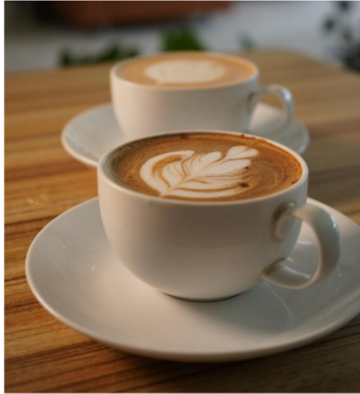
Gambar 3. Hasil pengambilan gambar dan penyuntingan mitra pengabdian