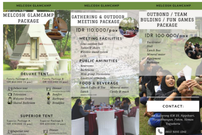
Gambar 5. Tangkapan layar media promosi berupa flyer

Bahasa Inggris dipilih menjadi bahasa utama dalam kedua media promosi yang pengabdian promosikan kepada para pegawai karena beberapa alasan. Pertama, masyarakat Indonesia dan masyarakat internasional sudah cukup terbiasa dengan penggunaan bahasa Inggris dalam kehidupan sehari-hari. Kedua, beberapa istilah dalam