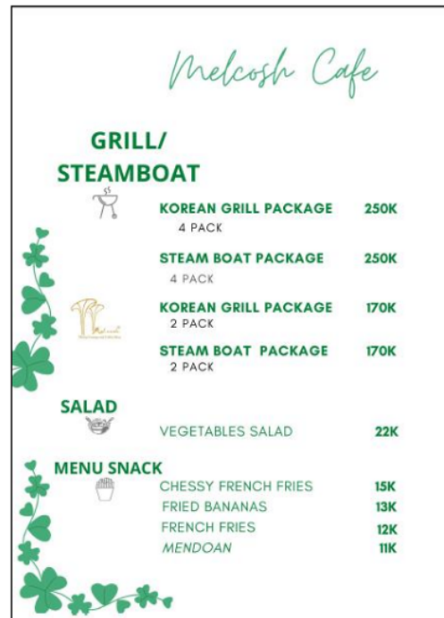
Gambar 2. Buku menu halaman 2

Seperti yang terlihat di gambar 1 dan 2, buku menu yang saat ini dipakai di Melcosh café & roastery sudah menggunakan Bahasa Inggris. Namun sayangnya, belum ada konsistensi di dalam penggunaan Bahasa. Pada gambar 1 misalnya, dalam salah satu menu paket Rice Bowl , terdapat nasi putih, fire chicken wings , cole slaw , dan es teh. Terdapat inkonsistensi Bahasa yang cukup tampak di bagian tersebut. Selain itu, masih terdapat juga kesalahan dalam hal tata Bahasa. Sebagai contoh, ada kesalahan dalam penulisan kata pax yang berarti orang, ditulis dengan kata pack yang menyatakan satuan bungkus. Walaupun bukan tergolong hal yang fatal, kesalahan ejaan seperti ini bisa mengubah arti kata dan menyebabkan kesalahpahaman (Altamimi & Ab Rashid, 2019). Selain itu, jika kesalahan-kesalahan kecil tidak diperbaiki, hal ini dikhawatirkan dapat memberi pengaruh negatif pada citra Melcosh café.