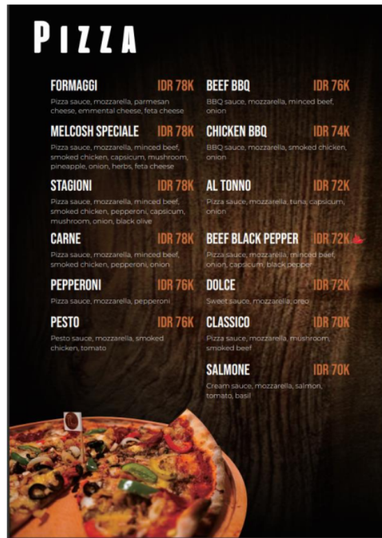
Gambar 4. Tangkapan layar buku menu