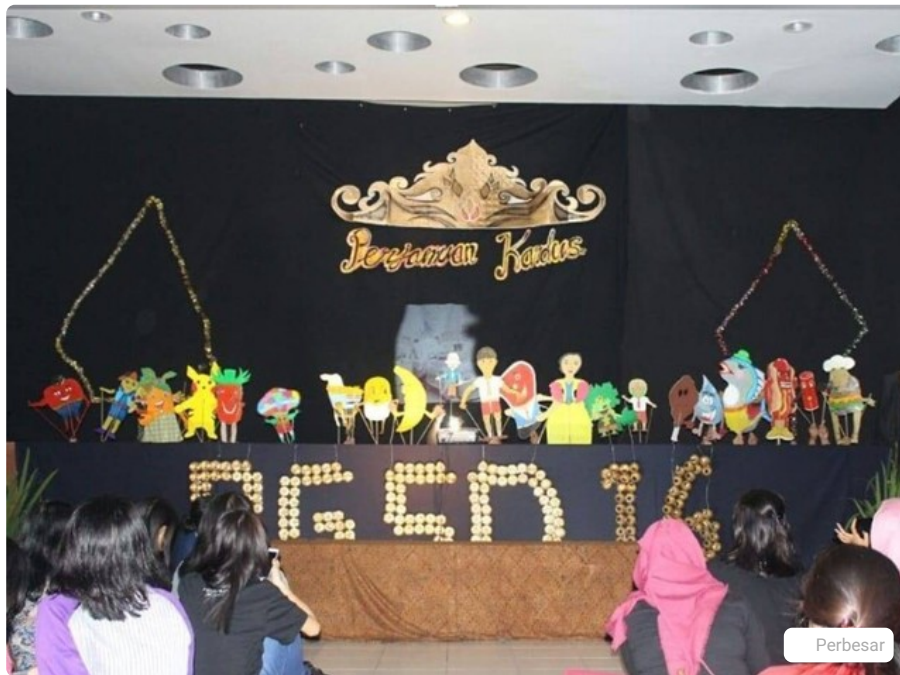
Pementasan wayang kardus oleh mahasiswa PGSD USD

Kampus Mahasiswa Calon Mahasiswa Jurusan Kuliah Kuliah Guru SD