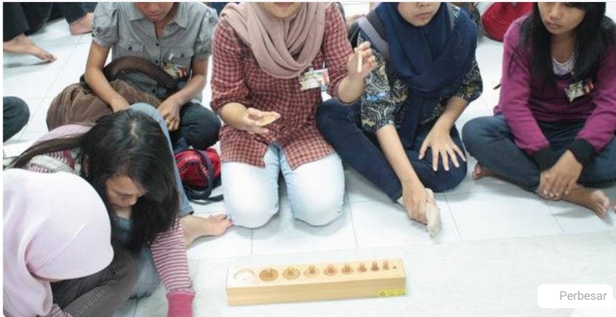
Mahasiswa mengikuti perkuliahan montessori

Mungkin PGSD USD adalah kampus yang memprakarsai diajarkannya kurikulum internasional untuk calon guru SD. Kurikulum internasional diajarkan untuk memfasilitasi mahasiswa yang berniat mengajar ke sekolah-sekolah internasional pun juga bagi mahasiswa yang ingin mengajar di pelosok tanah air tetapi dengan kerangka global yang berkualitas.