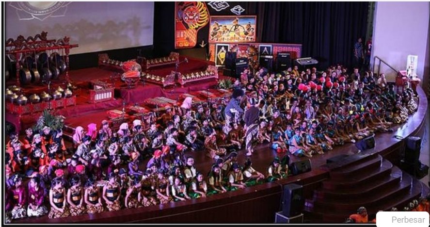
Mahasiswa PGSD USD menyelenggarakan Parade Gamelan Anak