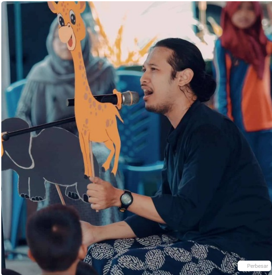
Mendongeng: Belajar Menyederhanakan Pikiran Abstrak, Dok. Pribadi

karena menghadirkan dunia imajinasi yang kaya dan penuh warna. Anak-anak dapat memasuki dunia dongeng dengan imajinasi mereka sendiri dan membayangkan karakter serta latar belakang cerita yang sedang mereka dengarkan atau baca. Selain itu, dongeng juga memberikan kesempatan bagi anak-anak untuk belajar tentang nilai-nilai kebaikan, kejujuran, dan keberanian yang terkadang disampaikan melalui tokoh-tokoh dalam cerita.