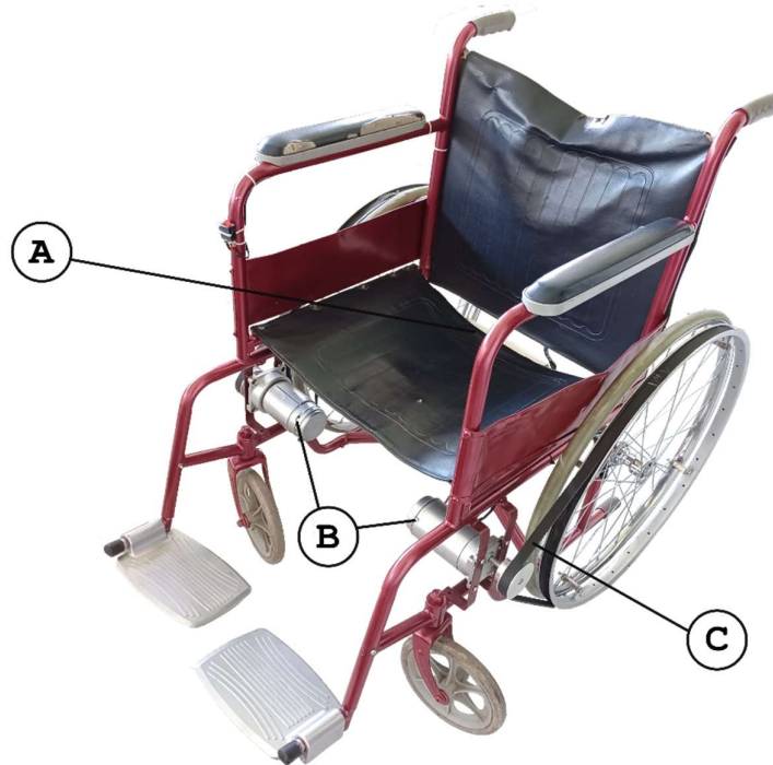
Gambar 3. Hasil realisasi modifikasi kursi roda konvensional menjadi elektrik

Hasil modifikasi kursi roda konvensional dengan penambahan dua buah motor DC berhasil dan bisa bekerja dengan baik. Kursi roda diuji dengan beban penumpang sampai 100 Kg dan bekerja dengan baik pada lantai mendatar. Dua motor DC yang digunakan sebagai penggerak masih bekerja dengan baik sampai dengan beban 100 Kg. Pengujian kursi roda elektrik dilakukan dengan beberapa kombinasi yaitu gerak maju, gerak mundur, belok kanan, dan belok kiri dengan menggunakan saklar (belum menggunakan aplikasi voice recognition ) dan hasilnya baik.