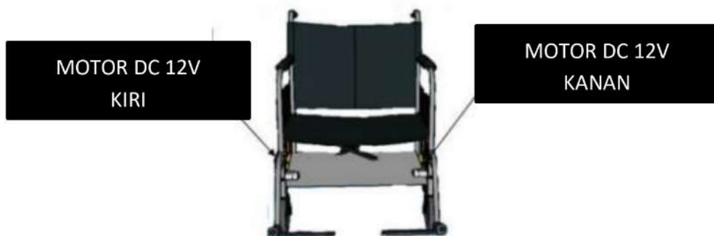
Gambar 1. Desain penggerak kursi roda menggunakan motor DC