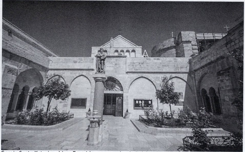
Gereja Santa Katarina, biara Fransiskan yang terletak di dalam kompleks Basilika Kelahiran.

Pintu masuk utama ke Gereja Kelahiran secara bertahap dibuat lebih rendah dan sempit untuk melindunginya dari penjajah. Prasasti pada bintang di Gua Kelahiran Yesus menyatakan: Hic de Virgin Maria Jesus Christus Natus Est . Artinya, “di sini Yesus