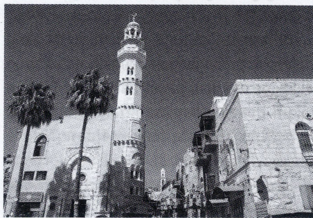
Masjid Umar. Khalifah Umar bin Khattab menetapkan Basilika Kelahiran akan tetap menjadi tempat ibadah umat Kristiani.

Salah satu tempat ziarah unik di Betlehem adalah Gua Susu yang diyakini sebagai tempat