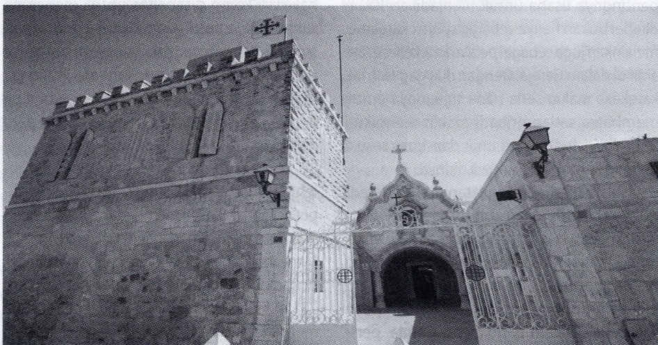
Gua Susu, diyakini sebagai tempat Keluarga Kudus berlindung dalam perjalanan ke Mesir.

Injil Matius maupun Lukas mencatat bahwa Yesus dilahirkan di sebuah desa sederhana di Betlehem (Mat. 2:1-12; Luk. 2:4-20). Lebih lanjut, Yohanes 7:42 menuturkan bahwa "Mesias berasal dari keturunan Daud dan