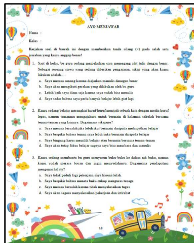
Gambar 5. Instrumen penilaian