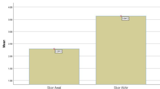
Gambar 7. Diagram Peningkatan Penilaian Diri Awal ke Penilaian Diri Akhir

Setelah rangkaian kegiatan selesai, kegiatan terakhir yakni anak mengerjakan penilaian diri akhir mengenai karakter rasa ingin tahu. Hasil uji coba instrumen karakter rasa ingin tahu adanya peningkatan skor penilaian diri awal dan penilaian diri akhir sebagai berikut.