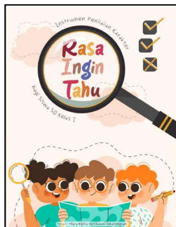
Gambar 1. Cover buku