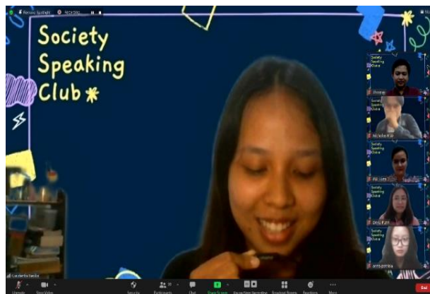
Gambar 1. Foto MC membuka acara SSC

Sesi pertama kegiatan Society Speaking Club dilaksanakan pada hari Jumat, 19 Februari 2021 pada pukul 16.00-17.30 WIB melalui Zoom meeting. Total peserta di sesi pertama adalah 27 peserta. Acara dibuka oleh MC dengan memperkenalkan garis besar program SSC dan tema diskusi kepada para peserta. MC juga memperkenalkan fasilitator yang akan mendampingi para peserta dalam berlatih speaking dan narasumber. Setelah sesi pembukaan oleh MC selama 10 menit, acara dilanjutkan dengan sesi pertama yang menghadirkan narasumber seorang Dosen Psikologi dari USD, yaitu Bapak C. Siswa W., M.Psi.