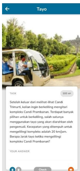
Gambar 9. Permasalahan nomor 5

Masalah: Siswa diminta untuk mencari jarak yang ditempuh tayo untuk mengelilingi candi-candi lain di kompleks Candi Prambanan.