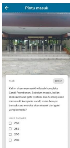
Gambar 1. Permasalahan nomor 1

Masalah: Siswa diminta untuk menyelesaikan mencari peluang untuk masuk menggunakan gate system .