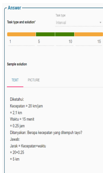
Gambar 10. Solusi dari permasalahan nomor 5

Peneliti melakukan penilaian untuk siswa dengan menggunakan rubrik penilaian. Penilaian diberikan untuk mengetahui kemampuan siswa dalam memecahkan masalah, serta melihat ide yang diberikan oleh siswa.