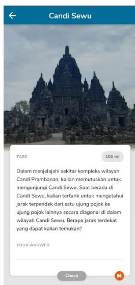
Gambar 7. Permasalahan nomor 4