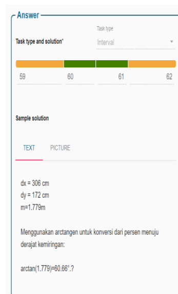
Gambar 5. Permasalahan nomor 3