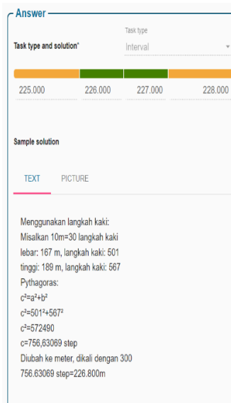
Gambar 8. Solusi dari permasalahan nomor 4