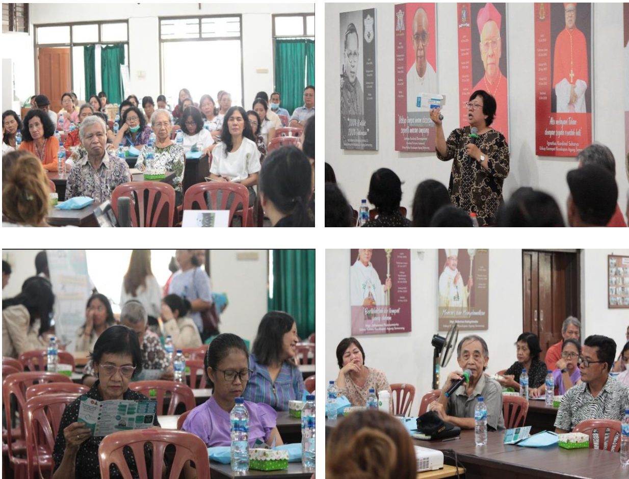
Gambar 3. Kegiatan Edukasi

Berdasarkan pertanyaan-pertanyaan tersebut, dapat diketahui bahwa pemahaman mengenai obat dalam kehidupan sehari-hari butuh diklarifikasi dan disesuaikan dengan yang seharusnya. Misalnya, aturan minum obat tiga kali sehari artinya obat diminum setiap 8 jam, bukan pada saat bersamaan dengan waktu makan. Penggunaan antibiotik juga mendapatkan perhatian dari beberapa peserta mengapa harus diminum sampai habis, sedangkan analgesik (misal parasetamol) hanya diminum pada saat sakit saja. Selain itu, muncul pertanyaan seputar penggunaan obat herbal oleh umat Paroki Warak apakah boleh digunakan bersamaan dengan obat yang didapatkan dari apotek. Acara ditutup dengan posttest oleh para peserta selama 10 menit dilanjutkan dengan penutup.