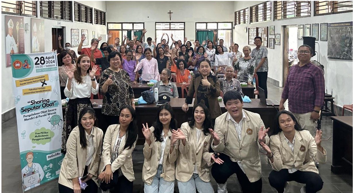
Gambar 4. Tim Pengabdian kepada Masyarakat, Tim Pelayanan Kesehatan dan Peserta Umat Paroki Warak