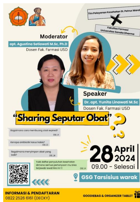
Gambar 1. Poster Publikasi Kegiatan

Pengabdian kepada masyarakat berupa edukasi pengelolaan obat secara mandiri di Paroki Warak diawali dengan sosialisasi kegiatan yang dilakukan dengan pemasangan poster publikasi kegiatan di halaman gedung Paroki Warak. Selain melalui pemasangan poster, sosialisasi juga dilakukan melalui pengumuman di gereja dan grup WhatsApp yang ada.