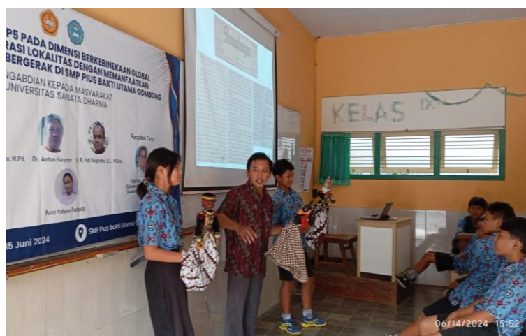
Gambar 3 Siswa Tertarik dengan Wayang Golek Menak Kebumen

Para peserta termotivasi saat penyampaian materi tentang penulisan sejarah lokal dan lisan. Seperti tampak pada Gambar 3, siswa semakin tertarik ketika memasuki materi eksplorasi sejarah dan budaya Gombong. Materi ini membuka cakrawala informasi yang selama ini ada di sekitar mereka, namun tidak disadari. Informasi sejarah publik yang dikemas secara populer berhasil memperluas pemahaman siswa akan masa lalu dan hubungannya dengan masa kini bahkan mendatang (Ashton & Trapeznik, 2019; Thorp, 2016). Apalagi narasumber juga mengajak seorang rekan dari komunitasnya untuk mengenalkan wayang golek menak Kebumen. Antusiasme siswa membuktikan sejarah dan budaya lokal dapat menjadi sumber belajar yang kontekstual (Wiyanti et al., 2020).