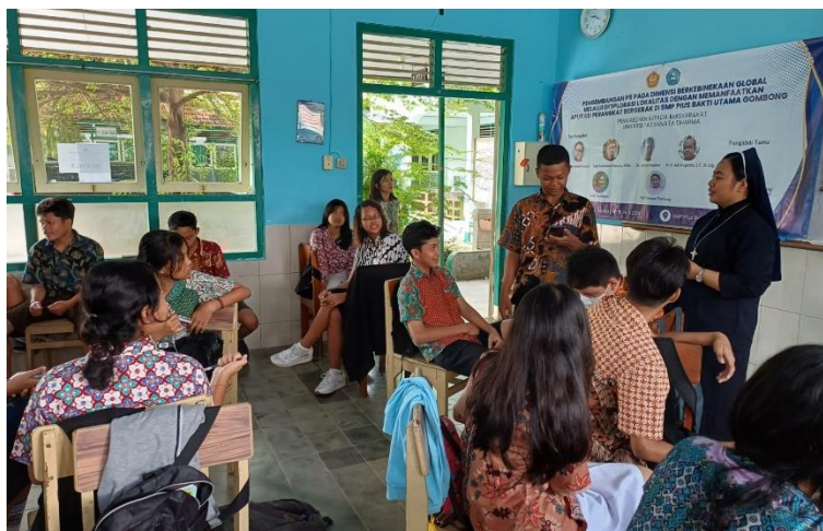
Gambar 4 Siswa Mempresentasikan Rencana Kontennya

Wijck, Rumah Sakit DKT, kerkof, bong Gumeng, Roemah Martha Tilaar, stasiun, bekas sekolah Tionghoa, petilasan, dan beberapa lainnya. Ada pula yang tertarik mengusung bisnis lokal, seperti perusahaan rokok Sintren, eks-perusahaan rokok Seger, dan sebagainya. Buku Ngomong Gombong: Remah Sejarah Kota 1830-1942 dapat menjadi sumber informasi yang memadai (Asmodiwongso & Nusiana, 2020). Pengalaman siswa ini menunjukkan bahwa kajian sejarah publik memungkinkan masyarakat termasuk siswa menjadi praktisi yang tidak hanya mengonsumsi namun juga memproduksi sejarah (Kurniawan, Supriatna, Mulyana, & Yulifar, 2023; Sayer, 2017).