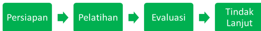
Gambar 1 Langkah-langkah Kegiatan

Pengabdian kepada masyarakat ini dilaksanakan untuk pemberdayaan masyarakat sasaran yakni 83 siswa bersama sepuluh guru di SMP Pius Bakti Utama Gombong. Sekolah ini beralamat di Jalan Yos Sudarso 239 Kecamatan Gombong, Kabupaten Kebumen, Provinsi Jawa Tengah. Strategi pemberdayaan dipilih karena keterlibatan masyarakat sasaran sesuai dengan karakteristik, situasi, dan kebutuhannya secara partisipatif sangat menentukan (Creswell, 2013). Setelah dilakukan identifikasi permasalahan dan kebutuhan, maka dirumuskan perencanaan program. Program mengusung dimensi berkebinekaan global dalam P5 untuk jenjang SMP yang mewadahi topik Bhinneka Tunggal Ika, kearifan lokal, serta berkayasa dan berteknologi untuk membangun Negara Kesatuan Republik Indonesia. Tiga topik ini diolah dan disajikan secara komprehensif sehingga menghasilkan aktivitas P5 bagi siswa dengan pendampingan guru.