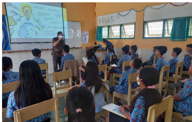
Gambar 2 Siswa Menyimak Materi dengan Antusias

Seperti tampak pada Gambar 2, pelatihan berlangsung lancar dan para peserta antusias. Dalam permainan “Mengupas Kubis”, para siswa sangat gembira dan berani menjawab pertanyaan-pertanyaan tentang kebinekaan di Indonesia. Hal ini penting karena pengetahuan awal atau prior knowledge menjadi konteks penting bagi siswa dalam menerima atau menolak informasi baru (Sutimin, 2019). Saat penyampaian materi berkebinekaan global, sebagian besar siswa menyebutkan kata-kata kunci yang bermakna seperti keberagaman, Nusantara, Bhinneka Tunggal Ika, akulturasi, hingga toleransi. Akan tetapi, sebagai bagian dari P5, tidak semua siswa kelas VII memahami sepenuhnya. Berbeda dengan siswa kelas VIII yang menceritakan tentang proyek P5 yang sudah beberapa kali mereka lakukan.