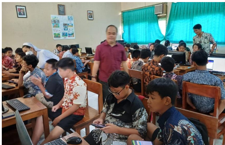
Gambar 5 Siswa Asyik Berlatih Menggunakan MIT App Inventor