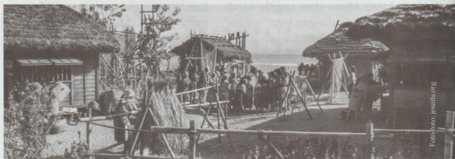
Umat Katolik di Jepang menunjukkan daya tahan dalam menghidupi imannya.

Pengajar pada Fakultas Sastra, Universitas Sanata Dharma Yogyakarta