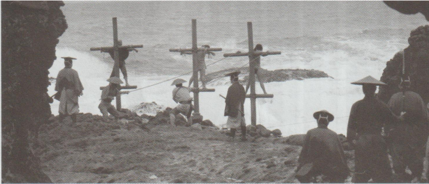
Lebih dari lima ribu Kirishitan (orang Kristen) diberitakan terbunuh sebagai martir.

bagai misionaris, saat itu Xaverius mengikatkan diri pada komunitas misi di Goa.