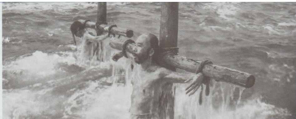
Hideyoshi menyalib misionaris Fransiskan dan Jesuit bersama dua katekis Jepang.

Kehadiran Kekatolikan di Jepang bermula dari misi Fransiskus Xaverius bersama kawan-kawannya. Pada 15 Agustus 1549, saat Hari Raya Santa Perawan Maria Diangkat ke Surga,