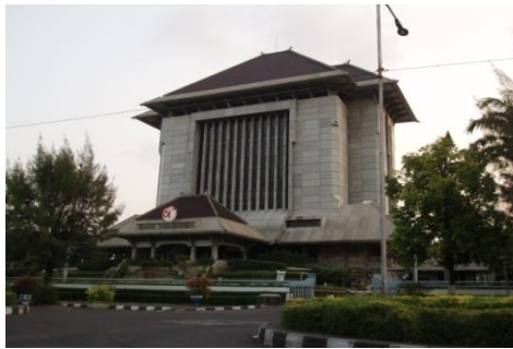
Gambar 6. Gedung Bank Indonesia

Berdasarkan UU No 23 Tahun 1999, Bank Indonesia dinyatakan sebagai badan hukum. Dengan status tersebut, Bank Indonesia mempunyai kewenangan untuk melakukan perbuatan hukum termasuk mengelola kekayaannya sendiri terlepas dari APBN. Selain itu, Bank Indonesia juga berwenang membuat peraturan yang mengikat masyarakat luas sesuai dengan tugas dan kewenangnya dan dapat bertindak atas namanya sendiri di dalam dan di luar pengadilan.