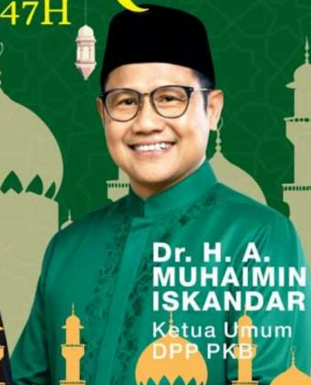
Dr. H. A. MUHAIMIN ISKANDAR Ketua Umum DPP PKB